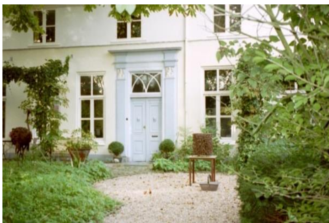
"huis de Grunerie", Van Cuycklaan 16 (in het zijstraatje),

Tijdens de borrel worden ook de laatste schilderstukken van wijlen de heer Kloos ten toon gesteld. Voor een paar euro neemt u een door u gekozen stuk mee naar huis.