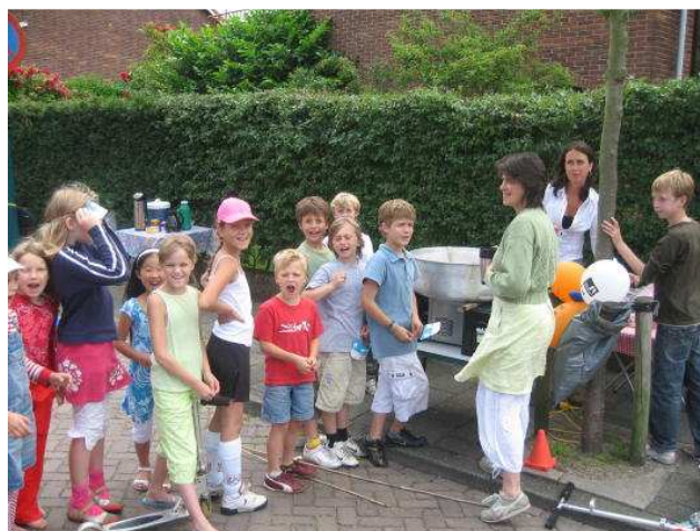
Archieffoto Straatspeeldag 2007

Het kruispunt Grunerielaan/Van Cuycklaan en deels de Van Cuycklaan worden op woensdag 12 juni vanaf 13.00 uur afgezet, houdt u hier a.u.b. vooraf rekening mee bij het parkeren!