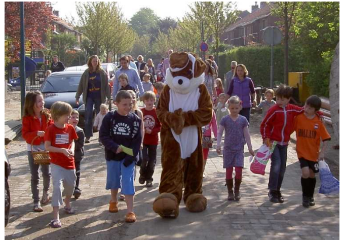
Archieffoto Pasen 2011

paashaas erg lastig werd om al zijn eieren en traktaties te verstoppert. De kinderen mochten daarom ook zoeken in de tuin van nummer 18 en wat deden ze weer hun best! De kleintjes hadden soms wat hulp nodig, vooral bij het zoeken van hun zakje met chocola.