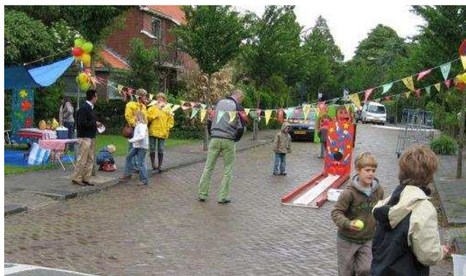
Archieffoto straatspeeldag 2006